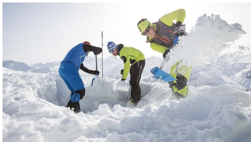
En mode recherche, pas d'équipement électronique, même éteint, à moins de 50 cm du DVA, et aucun appel à moins de 25-30 mètres du plus proche DVA

Dans tous les cas, il faut éviter de faire les deux en même temps . Donc, soit on alerte les secours immédiatement et on leur explique qu'on va devoir couper le téléphone pendant le temps de la recherche ; soit on fait la recherche immédiatement et on appelle les secours dès que l'on peut, a minima une fois la recherche DVA terminée.